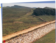
Una porzione del Vallo di Adriano.

Le costruzioni per la difesa del limes erano di vario tipo. In Britannia (l'attuale Gran Bretagna) l'imperatore Adriano fece costruire un Vallo, costituito da un lungo muro di circa 117 km, preceduto da una palizzata e da due fossati. Ogni tanto dal muro si ergevano torri di avvistamento . Anche in Africa si costruì un Vallo, mentre altrove il limes non era continuo, ma era formato da fortini sparsi .