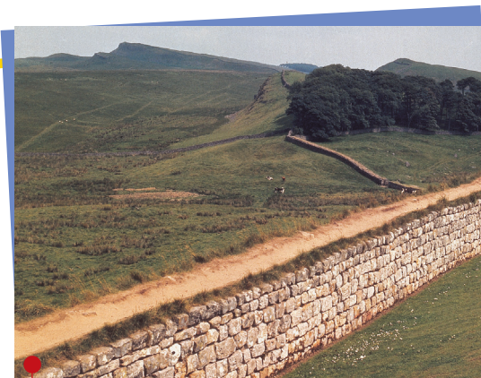
Una porzione del Vallo di Adriano.

Le costruzioni per la difesa del limes erano di vario tipo. In Britannia (l'attuale Gran Bretagna) l'imperatore Adriano fece costruire un Vallo, costituito da un lungo muro di circa 117 km, preceduto da una palizzata e da due fossati. Ogni tanto dal muro si ergevano torri di avvistamento . Anche in Africa si costruì un Vallo, mentre altrove il limes non era continuo, ma era formato da fortini sparsi .